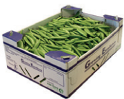
Colis de 5 kg en vrac