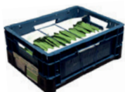
EPS 4 kilo-gram